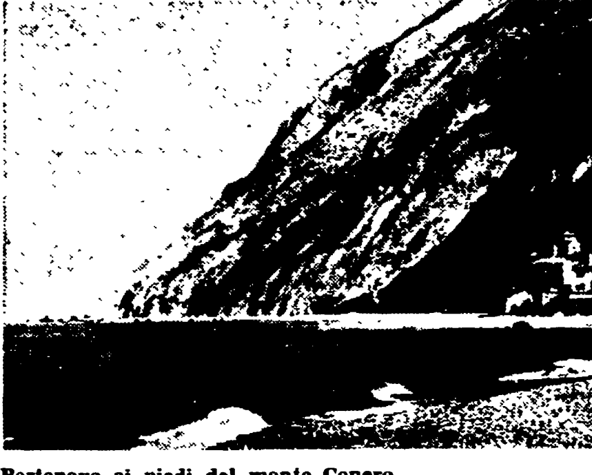
Portonovo ai piedi del monte Conero

Dalla nostra redazione ANCONA, 10. Settembre è il mese durante il quale le aziende propongono al turismo, tirando le somme della stagione andata, cercano di programmare la futura attività per migliorare l'attrezzatura, per creare le migliori condizioni di soggiorno per gli ospiti futuri.