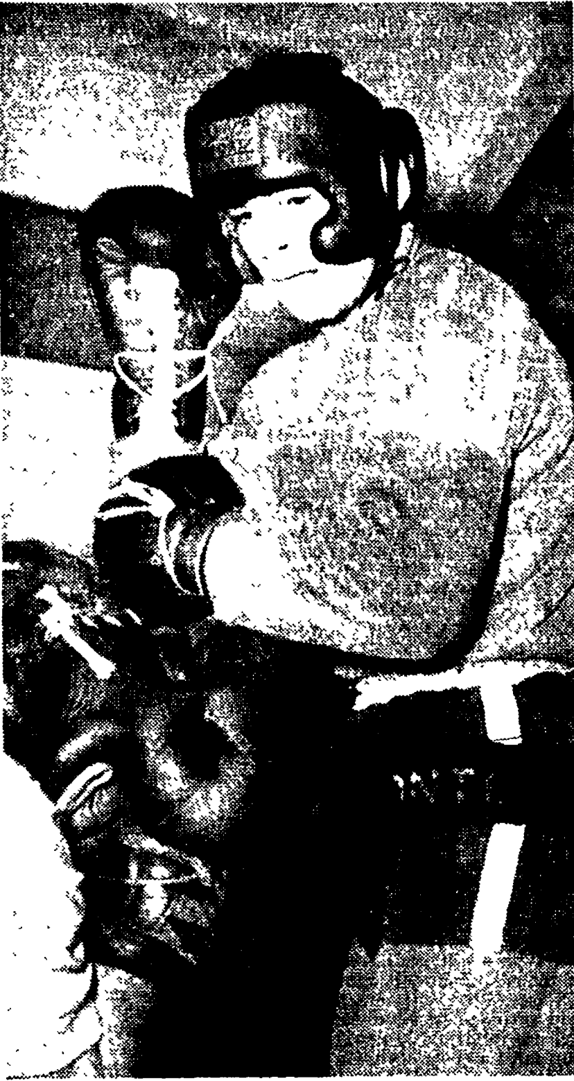
AMONTI avrà stasera un difficile compito contro Manzur