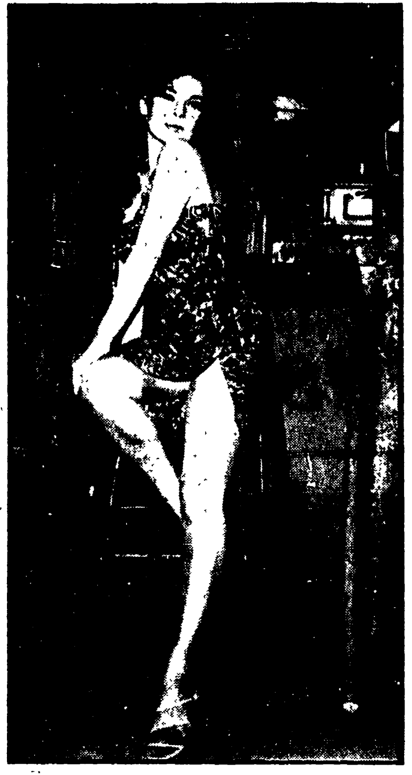
HOLLYWOOD — Abbe Lane alla TV americana. La cantante sudamericana, dal suo divorzio da Xavier Cugat, sembra aver ritrovato una grande scioltezza di movimenti