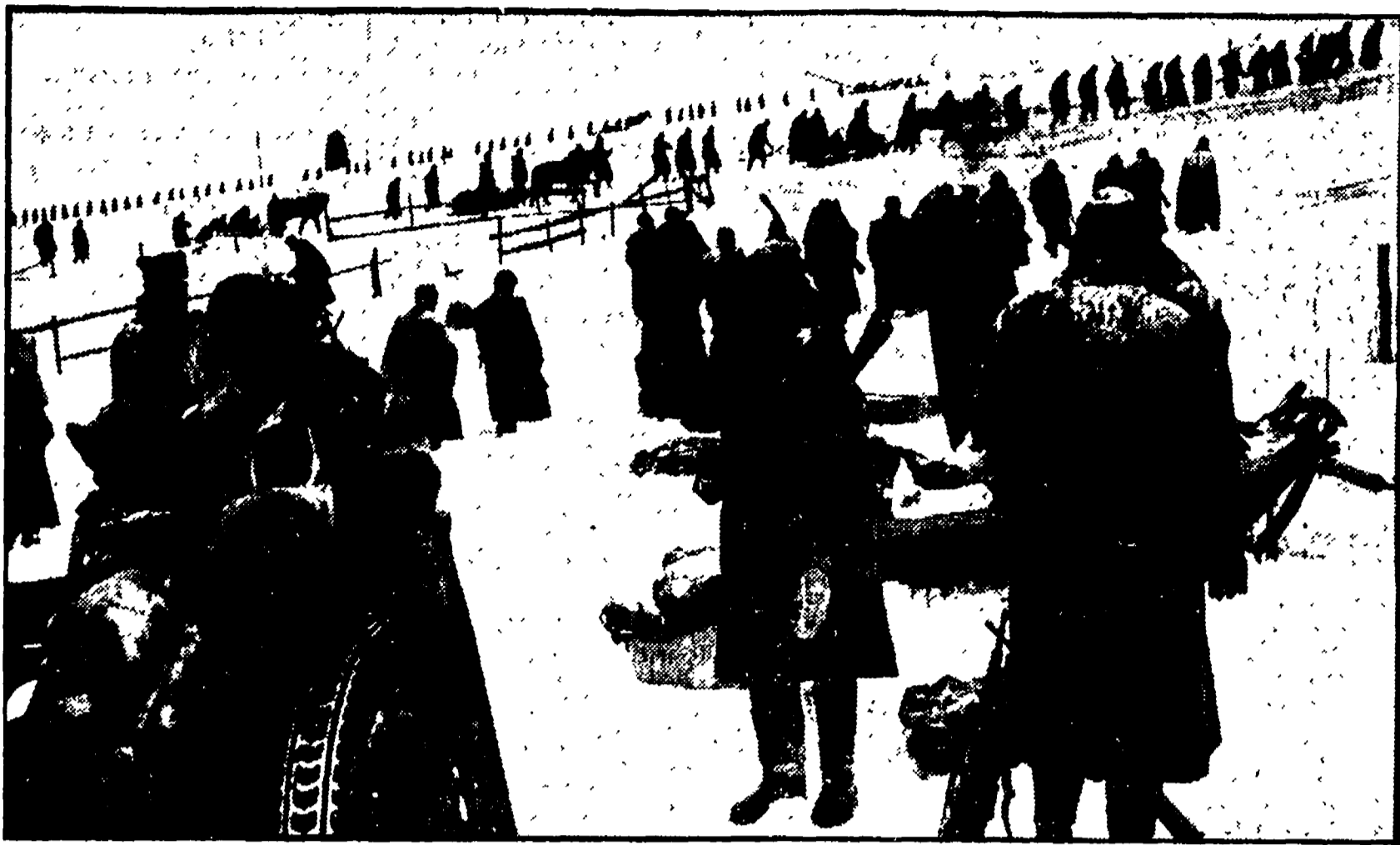
Una scena del film di Giuseppe De Santis, «Italiani brava gente»