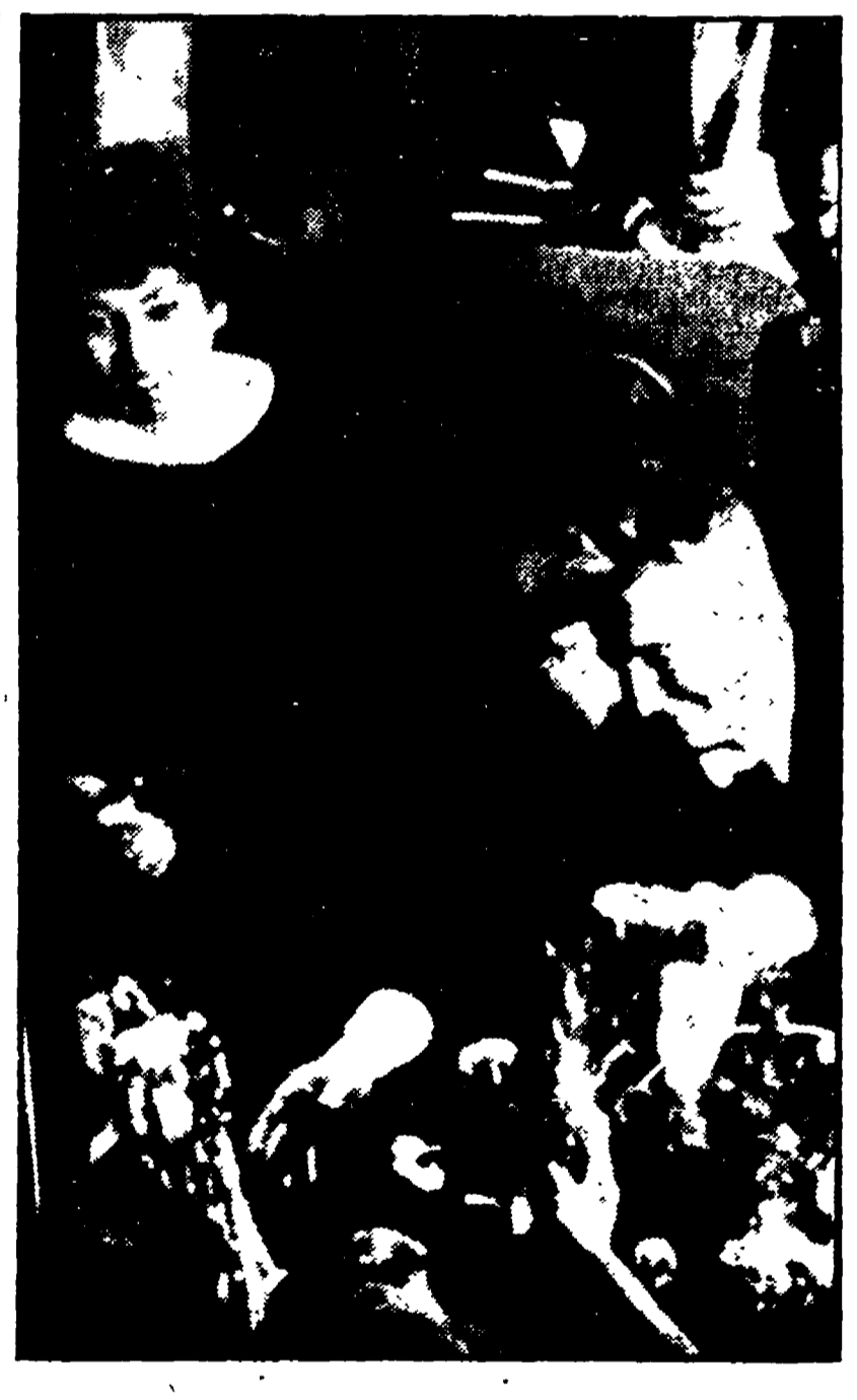
MOSCA, 24. Il Requiem di Giuseppe Verdi, eseguito ieri sera dal complesso della Scala al Teatro Bolscevico, presente la moglie del Primo Ministro sovietico Nina Khrushcheva, ha riscosso un trionfo che non è esagerato definire clamoroso.