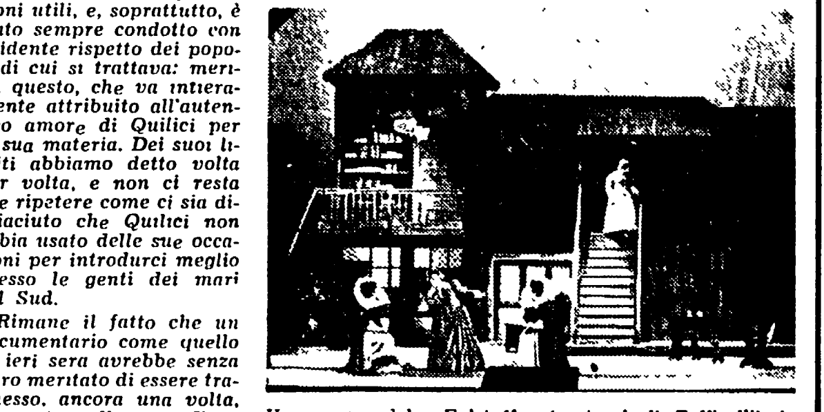
Una scena del «Falstaff» (costumi di Zeffirelli) in onda alle 21,15 (secondo canale)

Radio - nazionale. Giornale radio: 7, 8, 13, 15, 17, 20, 23, 6:35 Corsi di lingua portoghese; 8,30: 11 nostro buongiorno; 10,30: Silas Marner; 11: Passeggiata nel tempo; 11,15: Aria di casa nostra; 11,45: Musica per archi; 12: Gli amici delle 12; 12,30: Arlecchino; 12 e 55: Chi vuol esser lieto...; 13,15: Zig-Zag; 13,25-14: Coriandoli; 14-14,55: Trasmissioni regionali; 15,15: La ronda delle arti; 15,30: Un quarto d'ora di novità; 15,45: Quadrante economico; 16: Programma per i ragazzi; 16,30: Corriere del disco; 16,35: Panorama di motivi; 16,50: Concerto sinfonico; 18,50: Visita a un Centro di Studio; 19: Istituto Donegani di Novara; 19,10: La voce dei lavoratori; 19,30: Motivi in glosstra; 19,53: Una canzone al giorno; 20,20: Applausi a...; 20,25: La locandiera; di Carlo Goldoni; 22,25: Musica da ballo.