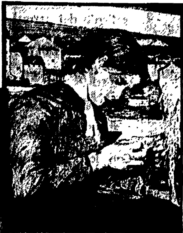
GIOVANNI SEGANTINI: «Ragazza che fa la calza»