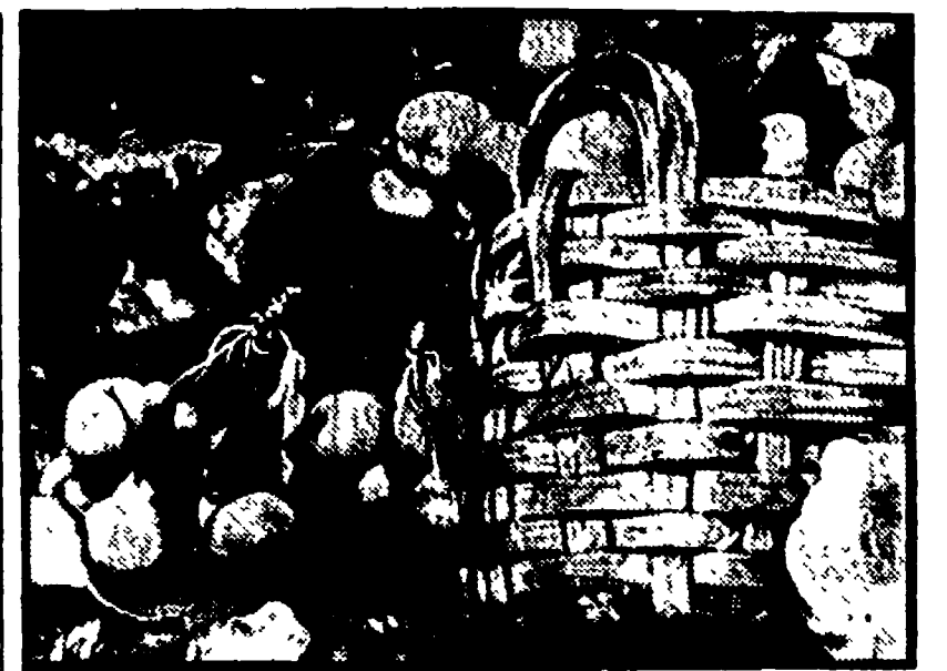
TOMMASO SALINI: «Natura morta» (particolare)

Lungo le pareti devastate dalle fiamme del «Salone delle Castelli» nel Palazzo Reale di Milano, sono in questi giorni allineate le opere che hanno partecipato al Premio Ramazzotti.