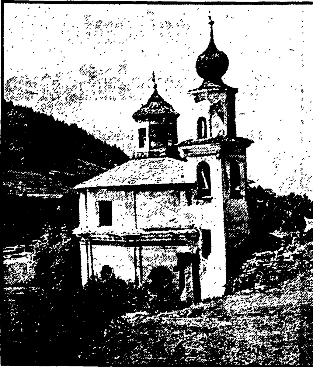
Il santuario della Madonna presso Bormio (1698)