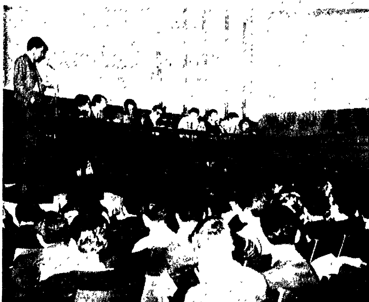
Un momento dell'attivo dei giovani comunisti, mentre parla il segretario della FGCI