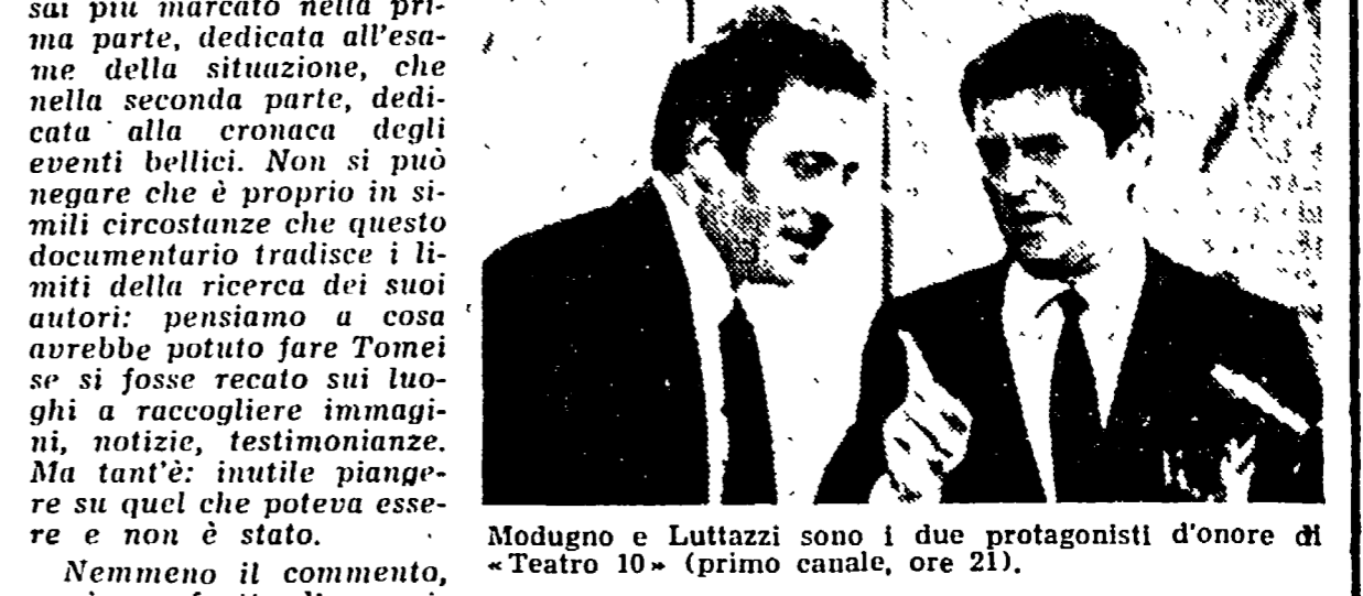
Modugno e Luttazzi sono i due protagonisti d'onore di «Teatro 10» (primo canale, ore 21).