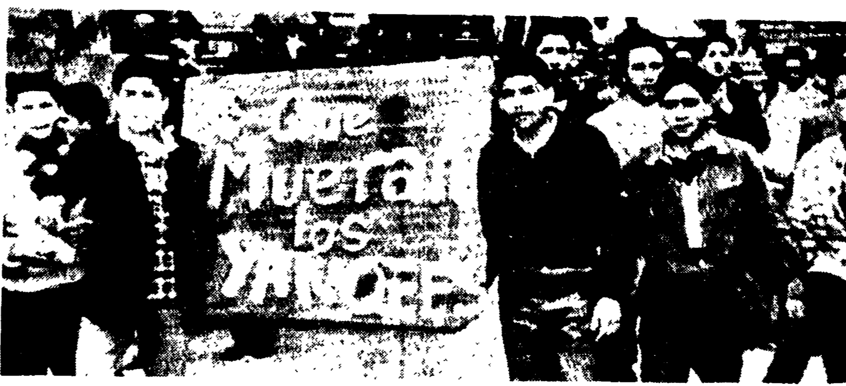
LA PAZ — Una dimostrazione di studenti per le vie della capitale

La dimostrazione è nell'esito dello sciopero cominciato stamane, il primo indetto dalla sola CGIL in questa ultima fase della vertenza.