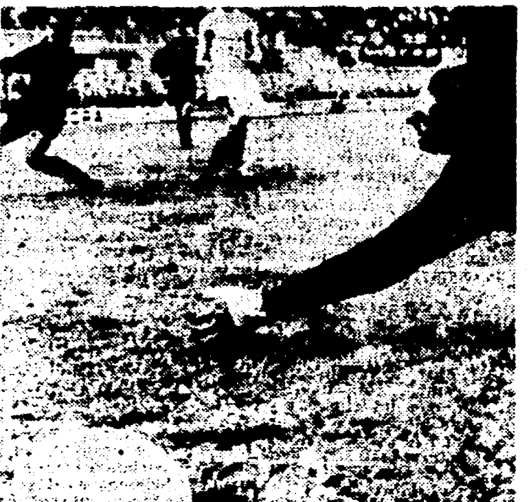
Dalla nostra redazione

MILANO, 11. — Il novantesimo minuto di Milan-Lazio non ha trovato soddisfatta nessuna delle squadre: i biancocesti, ovviamente, per la sconfitta che in parte avevano voluto: i rossoneri per il gioco poco convincente (nonostante alcuni geniali «suggerimenti» del rientrante Rivera) con cui hanno presentato al loro deluso pubblico la prima partita in casa di questo campionato.