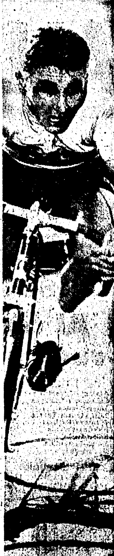
Anquetil si è ritirato