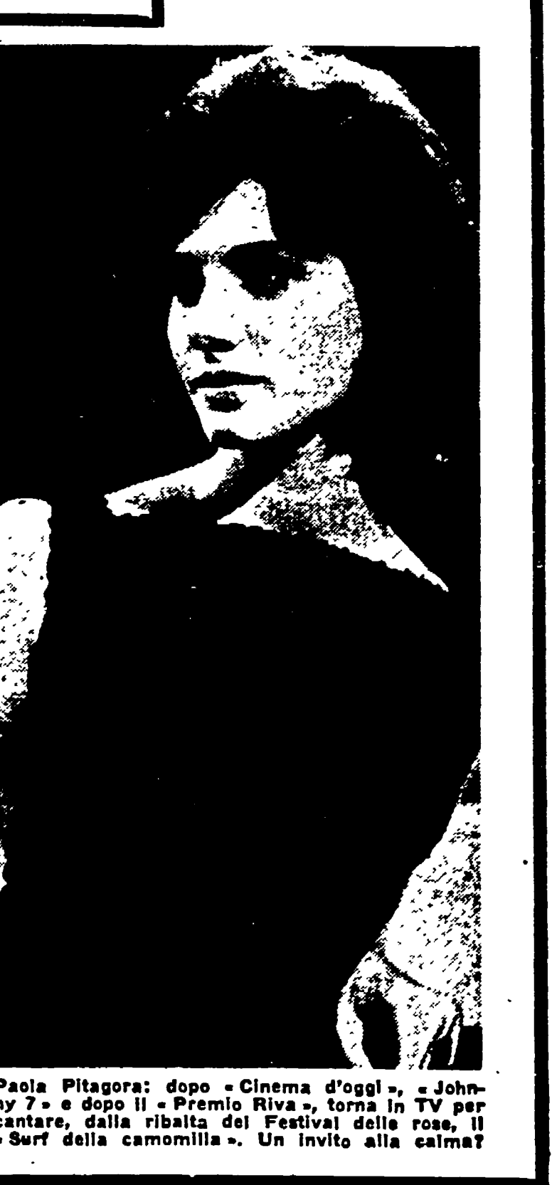
Paola Pitagora: dopo «Cinema d'oggi», «Johnny 7» e dopo il «Premio Riva», torna in TV per cantare, dalla ribalta del Festival delle rose, il «Surf della camomilla». Un invito alla calma!

Il pubblico propone... I sondaggi sulle opinioni dei telespettatori, a cominciare da quelli compiuti dalla RAI, hanno purtroppo un valore relativo, perché non esistono ancora oggi canali ben precisi che permettano al giudice del pubblico di emergere con sufficiente chiarezza. Ci si arresta, di solito, alla generica indicazione delle preferenze e del gradimento: ma i dati non sono mai tali da consentire una seria valutazione delle ragioni di certe scelte e di certi rifiuti.