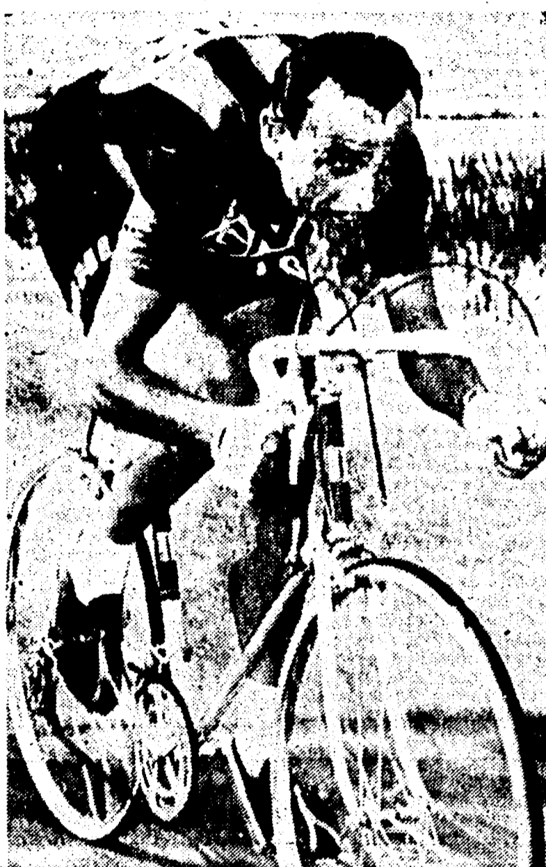
Motta e Fornoni, fra l'altro favoriti dal sorteggio, potrebbero riuscire a vincere il Trofeo Baracchi che si corre domani a Bergamo. Si tratta comunque di un'impresa che non sarà facile da realizzare essendo in gara il fior fiore degli specialisti di questo tipo di ciclismo.