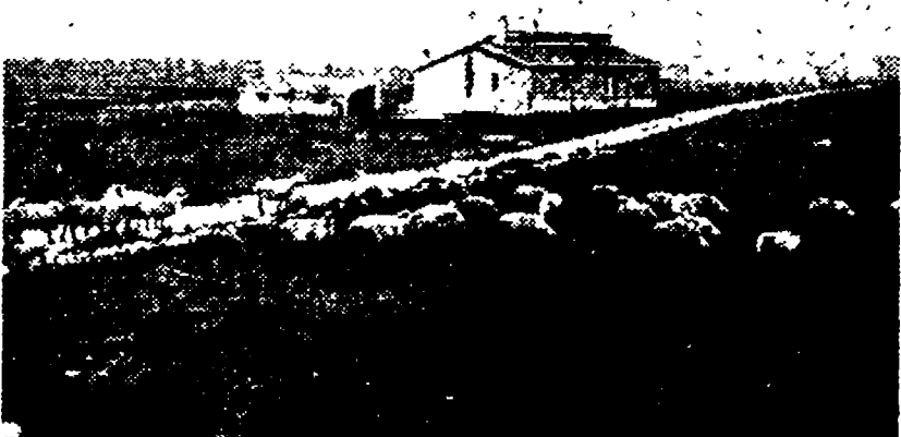
Casa colonica abbandonata in un agro di Spinazzola