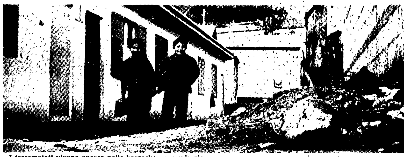
I terremotati vivono ancora nelle baracche «provvisorie»