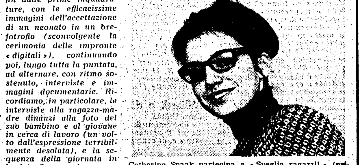
Catherine Spaak partecipa a «Sveglia ragazzi!» (primo, ore 21)