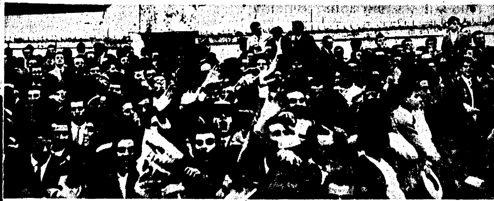
Uno spettacolo di folla che era cosa consueta fino a pochi mesi addietro e che oggi è una specie di chimera.