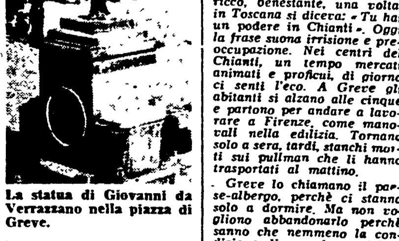
La statua di Giovanni da Verrazzano nella piazza di Greve.