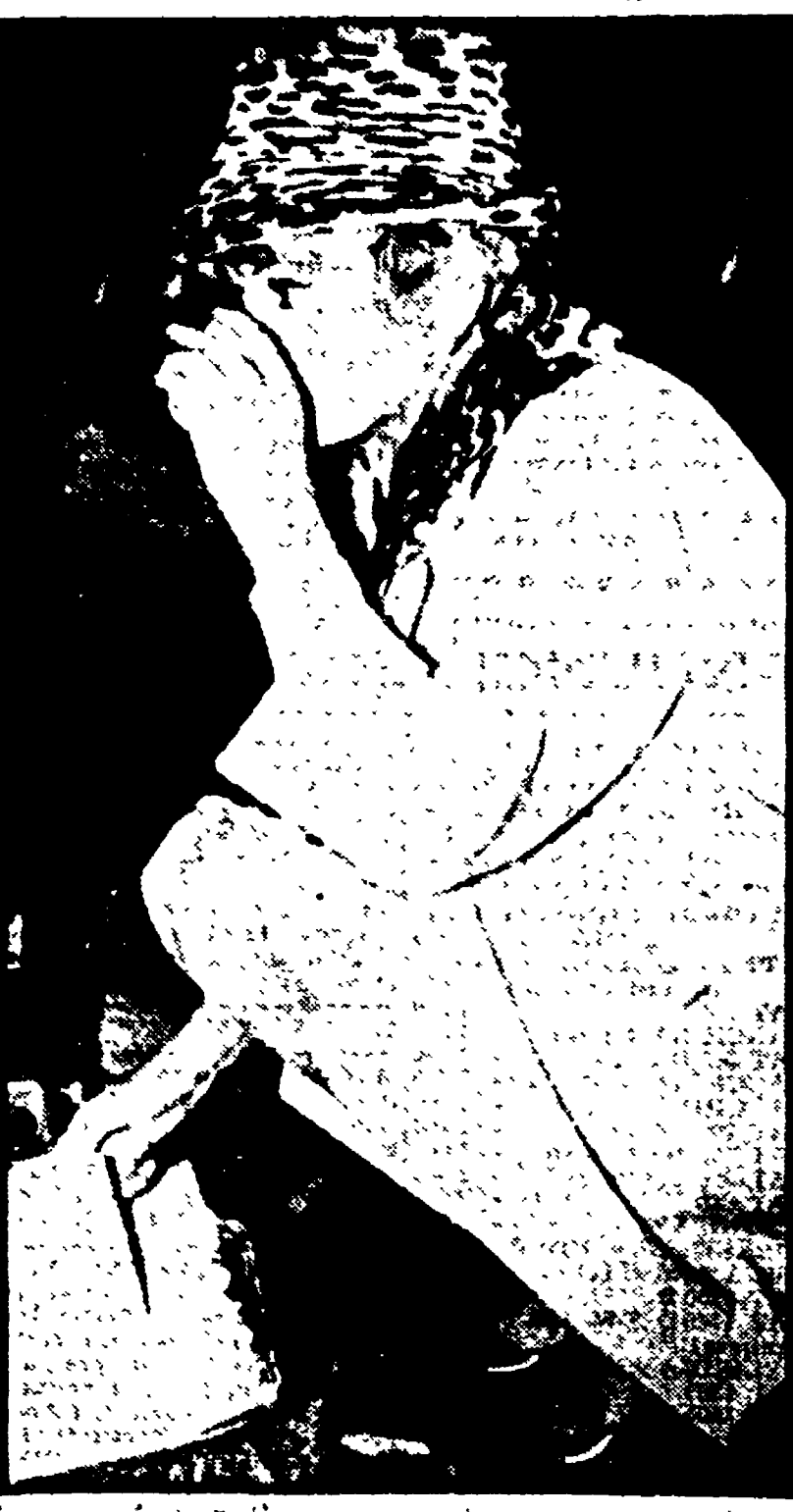
BOREHEMWOOD - Anita Ekberg, che sta girando in Inghilterra «L'ABC del delitto», si riscalda con una tazza di caffè durante una pausa del lavoro (telefoto)