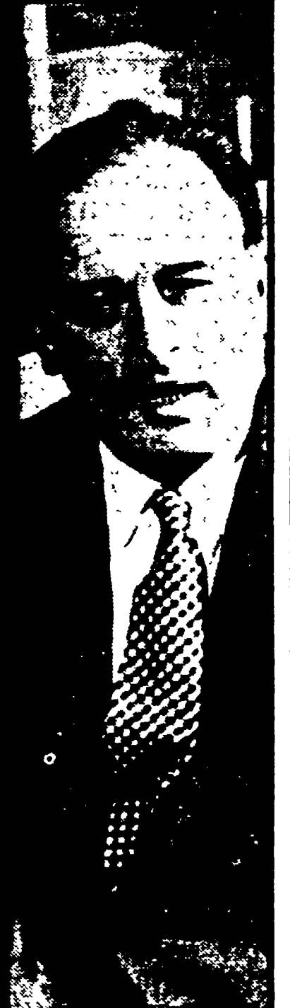
Oggi, 23 dicembre, andrà in scena al Teatro dell'Opera di Roma la «Tosca» di Puccini...