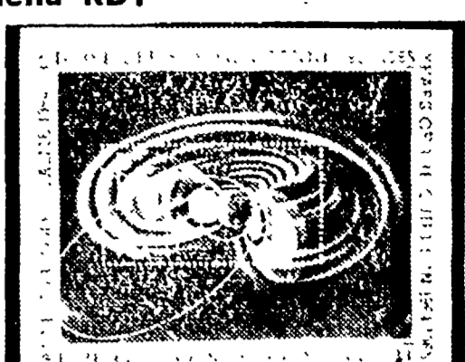
Il 29 dicembre le Poste della Repubblica democratica tedesca hanno emesso una serie di 3 valori dedicati al sole equinoziale.