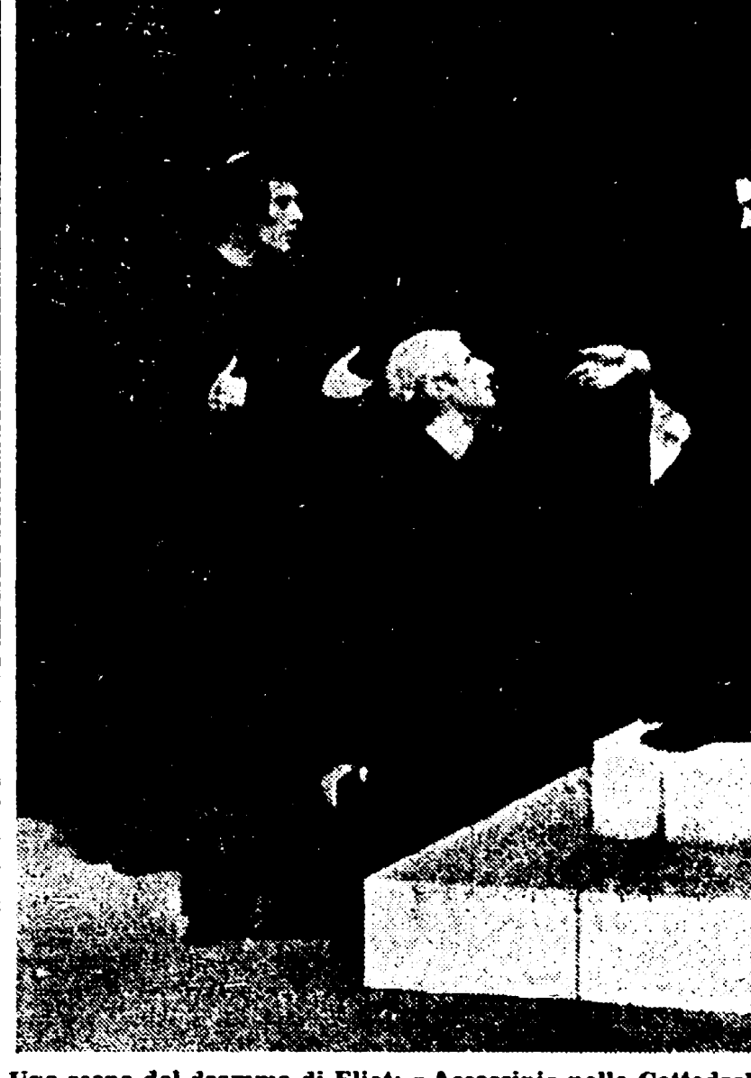
Una scena del dramma di Eliot: «Assassino nella Cattedrale» rappresentato al festival di Verona nel 1951

LONDRA. 4. Il grande poeta inglese Thomas Stearns Eliot è morto oggi a Londra. Aveva 77 anni. Nel 1948 vinse il Nobel per la letteratura.