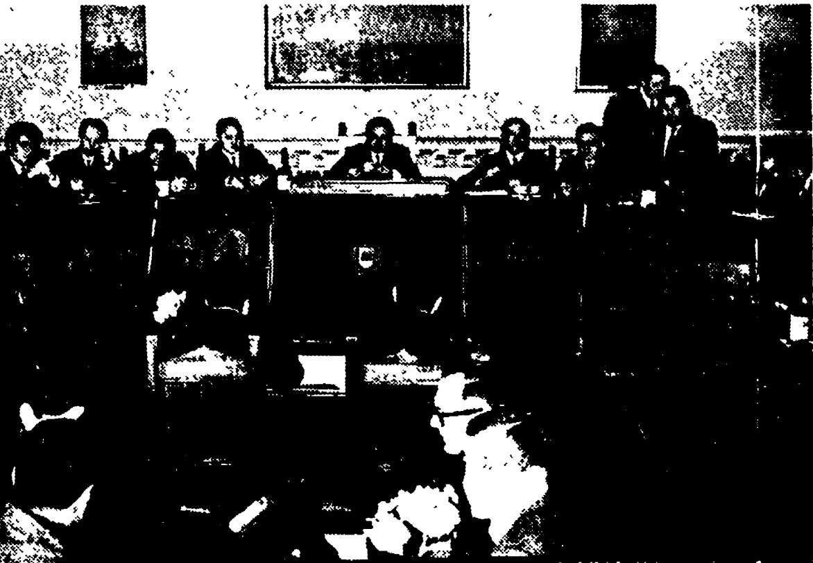
La nuova Giunta di sinistra eletta a Piombino, si è ufficialmente insediata. Ecco la foto della prima riunione...