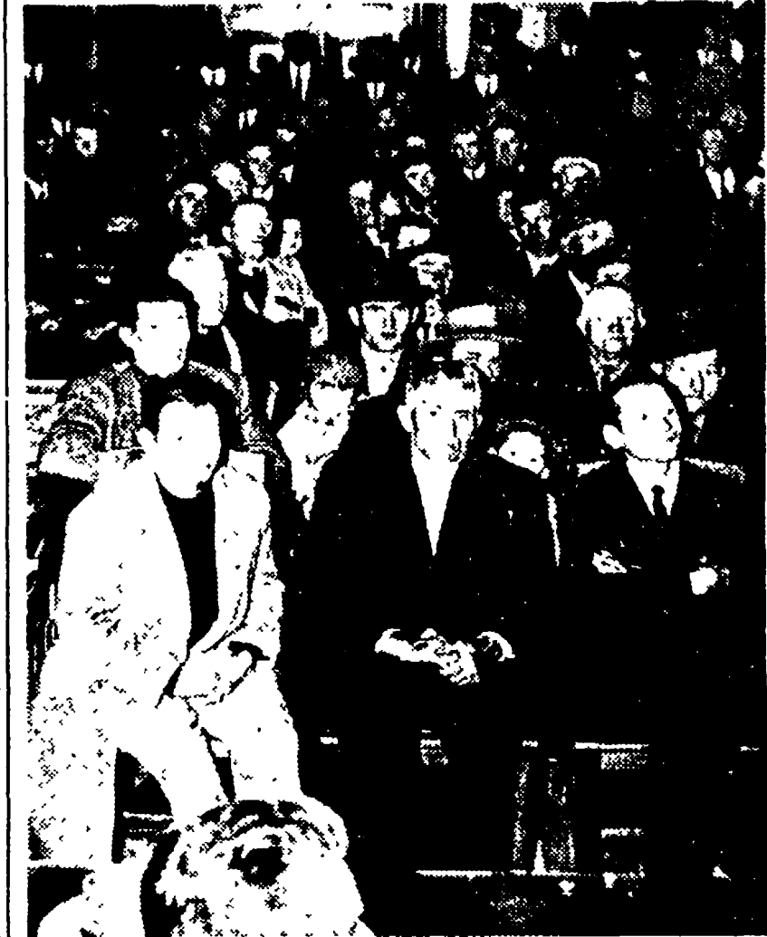
Un momento dell'assemblea dei fittavoli a Bari

La relazione del segretario dell'Alleanza contadini - Un esame della situazione