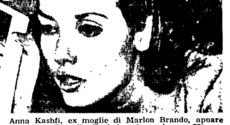
Anna Kashfi, ex moglie di Marlon Brando, appare nel telefilm «L'anello di giada» (secondo, ore 22).

Le manifestazioni sportive: di domenica 15,40: Sorella radio; 16:30: Corriere del disco; musica lirica; 17:25: Estrazioni del Lotto; 17:30: Concerti per la gioventù; 19:10: Il settimanale dell'industria; 19:30: Motivi in giostra; 19:50: Una canzone al giorno; 20:20: Applausi a...; 20:25: Radiotelefortuna 1963; 20:30: Il fedelissimo; 21:30: Canzoni e melodie italiane; 22: Una storia tra i mari italiani; 22:30: Musica da ballo.