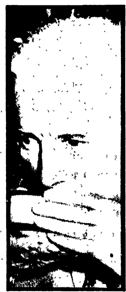
Charlie Chaplin e Sophia Loren faranno un film insieme?

Probabile, se Sophia riuscirà a liberarsi dai numerosi impegni cinematografici già in programma per i prossimi anni. La proposta è venuta a questa risulta, dallo stesso Chaplin, il quale, anche nelle interviste più recenti, ha sempre detto di avere intenzione di tornare presto al lavoro cinematografico in alcune dichiarazioni alla stampa. Chaplin non ha neppure nascosto la propria simpatia per l'attrice Sophia Loren. Chaplin ha dunque scritto a Sophia, esponendole il progetto di un film insieme. Egli ne scriverebbe la sceneggiatura e ne curerebbe la regia, ha precisato nella lettera, senza tuttavia accennare al soggetto e alla data di lavorazione. La proposta ha ovviamente molto interessato la Loren, ma nell'ambiente cinematografico romano non si fa mistero della difficoltà di realizzazione di un simile progetto. Si fa osservare, tra l'altro, che Carlo Ponti è legato all'ambiente cinematografico hollywoodiano; quello stesso ambiente che non vedrebbe di buon occhio un film di Chaplin, per il quale, in America, non ha troppe simpatie.