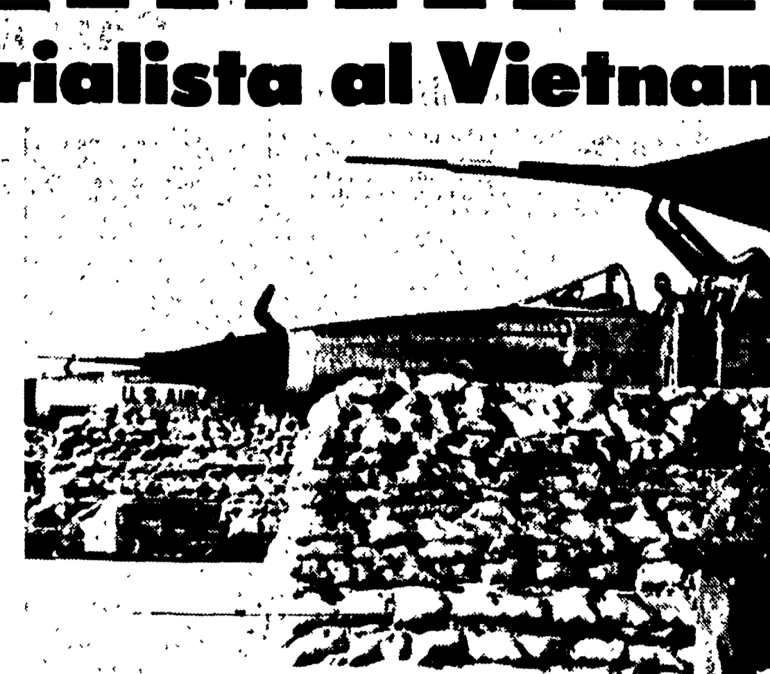
Una foto eloquente che dimostra il completo isolamento e il clima di terrore in cui vivono gli americani e i loro mercenari sud-vietnamiti. E' stata presa a Da Nang...