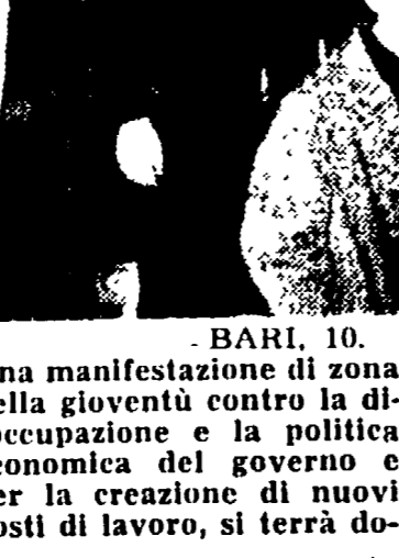
BARI. 10. Una manifestazione di zona della gioventù contro la disoccupazione e la politica economica del governo e per la creazione di nuovi posti di lavoro, si terrà do-

mani a Corato. La manifestazione si concluderà con un comizio del segretario provinciale della FGCI Domenico D'Onofrio.