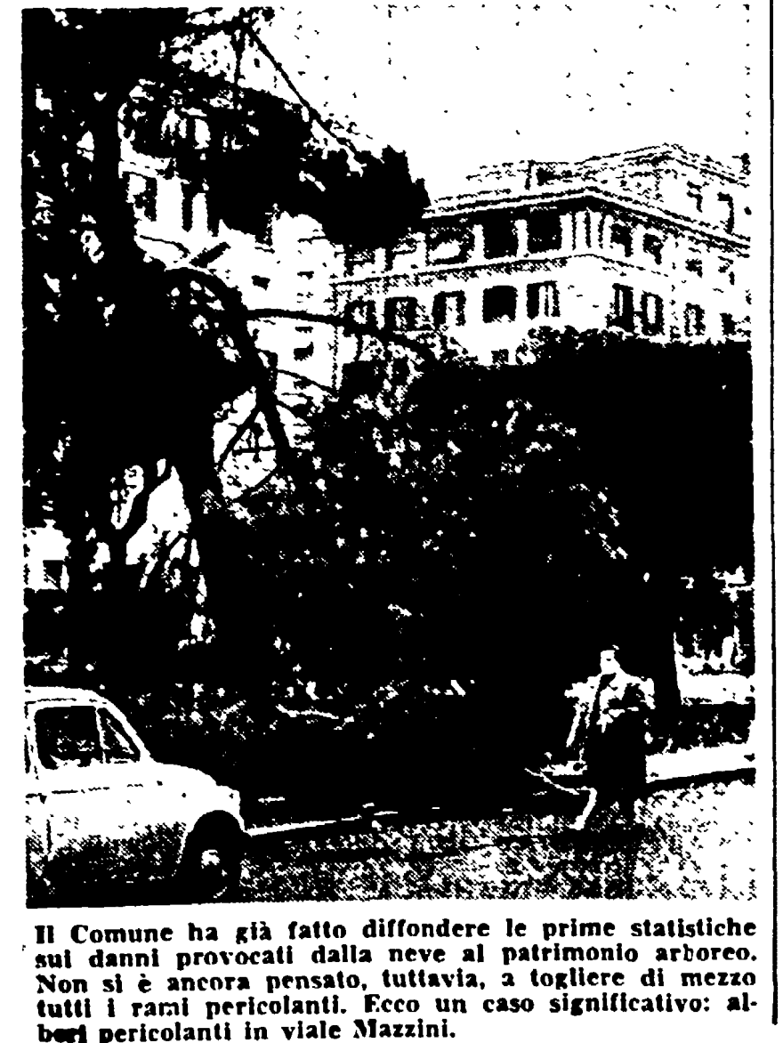
Il Comune ha già fatto diffondere le prime statistiche sui danni provocati dalla perdita di patrimonio arboreo. Non si è ancora pensati, tuttavia, a togliere di mezzo tutti i rami pericolanti. Ecco un caso significativo: alberi pericolanti in viale Mazzini.