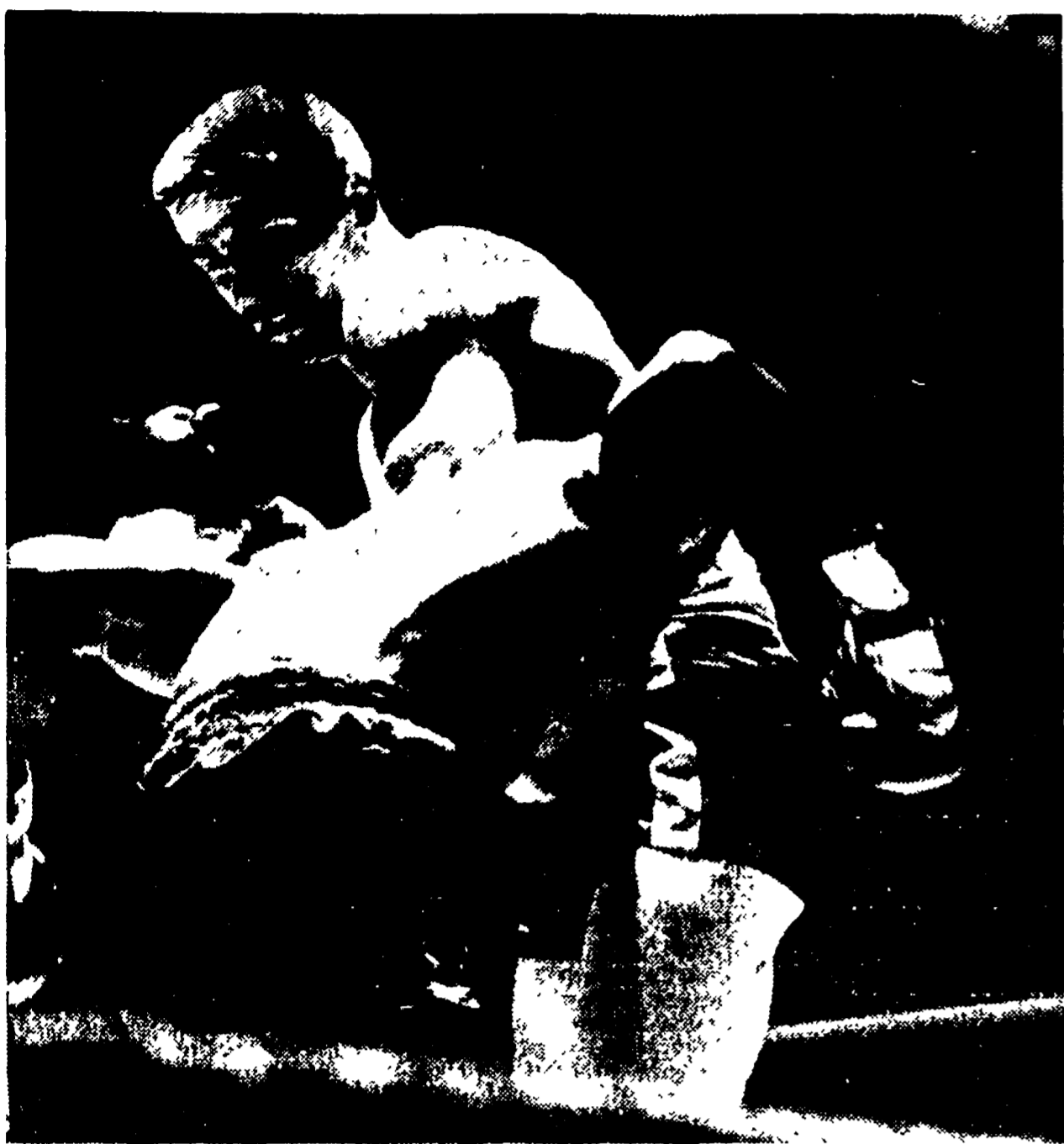
BENVENUTI non avrà un compito facile stasera sul ring di Milano.