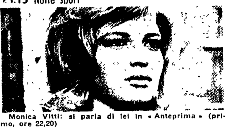
Monica Vitti: si parla di lei in «Anteprima» (primo, ore 22,20)

Giornale radio: 7, 8, 13, 15, 17, 20, 23, 6:30. Corso in discoteca: 11:25. Canzoni indimenticabili: 18. La comicità umana: 18.10. Musica di compositori italiani: 18.50. Piccolo concerto: 19.10. Gioco ciclistico della Sardegna: 19.20. Gente del nostro tempo: 19.30. Motivi in gio: 19.50. Una canzone al giorno: 20.20. Melodie napoletane: 20.25. Cartoline Illustrate: 21. Bourbourouche. Commedia in due atti di Georges Courteline: 21.50. Melodie napoletane: 21.55. Taccuino musicale: 15.30. 15.45. Quattro successi: 15.45. Quattro successi: 15.45. Quattro successi: 15.45.