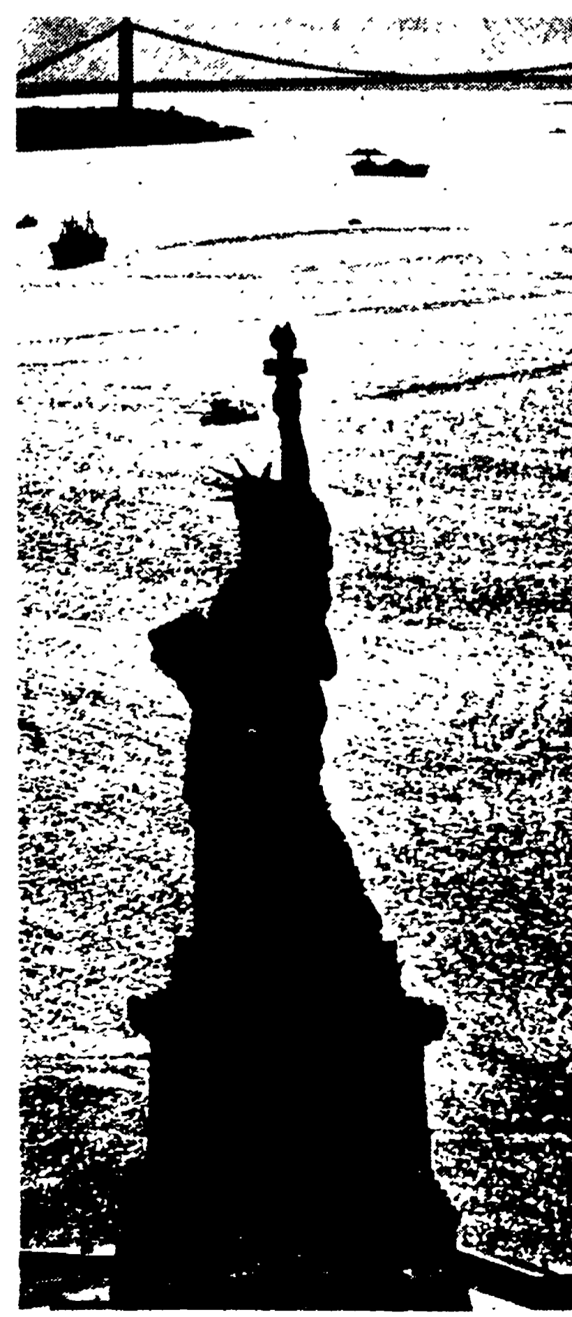
NEW YORK — Una suggestiva immagine del porto con in primo piano la statua della Libertà.