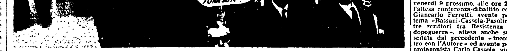
BARI - Un aspetto della «marcia della pace» svoltasi domenica scorsa per iniziativa di un gruppo di intellettuali e docenti dell'Università. Alla manifestazione hanno partecipato folte delegazioni contadine di tutta la provincia