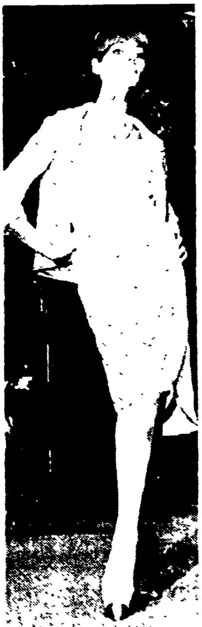
PARIGI — Una delle ultime creazioni di Chanel.

Non staremmo qui a far dettagli: stabilito che il 98 per cento della popolazione adulta femminile è compresa entro i limiti di 14-180 cm. di statura, si è deciso di suddividerla ancora, sempre secondo statura in quattro categorie... (text continues)