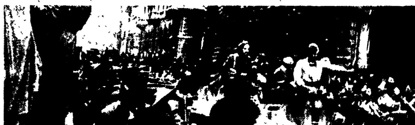
Le truppe alleate entrano a Bologna liberata dai partigiani

La città era stata circondata di cannoni. «Avete evitato un massacro cacciando i tedeschi», disse il comandante polacco. Si concludeva così la lunga lotta dei partigiani emiliani che già sei mesi prima erano pronti a liberare le loro città e le loro campagne. La stasi delle forze alleate sulla linea gotica