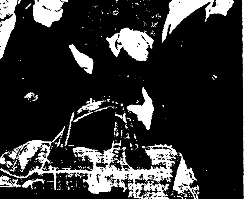
Un po' d'allegria a Termini dopo l'avventura