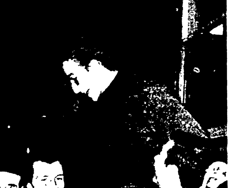
Il rientro a Termini