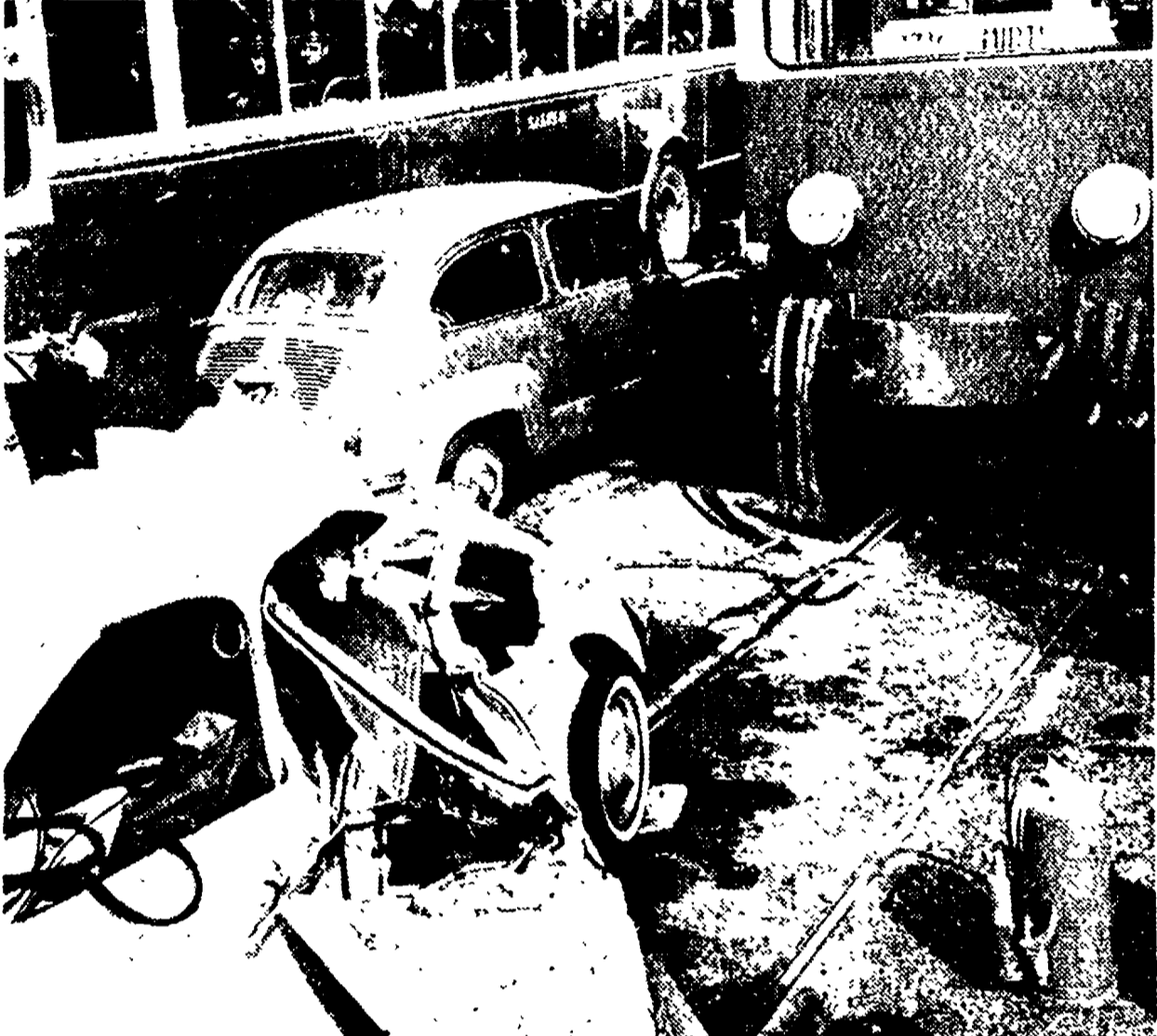
Sulla Casilina. Un morto e due feriti gravissimi sono il bilancio dello scontro tra una «600» e un tramvetto della STEFER avvenuto ieri alle 15,30 in un punto della via Casilina tristemente noto per il numero di incidenti che vi avvengono: poco prima di Centocelle cioè dove i binari della linea tranviaria tagliano la strada statale diagonalmente.

Sei mesi di indagini hanno permesso agli agenti della Finanza di mettere le mani su tre trafficanti di stupefacenti, di sequestrare oltre un chilo di cocaina, per un valore di circa 30 milioni, sul mercato clandestino, e di mettere a soqquadro quella che si ritiene essere una delle più forti organizzazioni di spacciatori. Questi disponevano, infatti, tra l'altro, di un attrezzato laboratorio per la trasformazione in cloridrato di cocaina della droga grezza. Gente altissima, almeno nel campo della chimica organica: la cocaina sequestrata raggiunge infatti un grado di purezza (97 per mille) simile a quello realizzato dai più attrezzati laboratori farmaceutici.