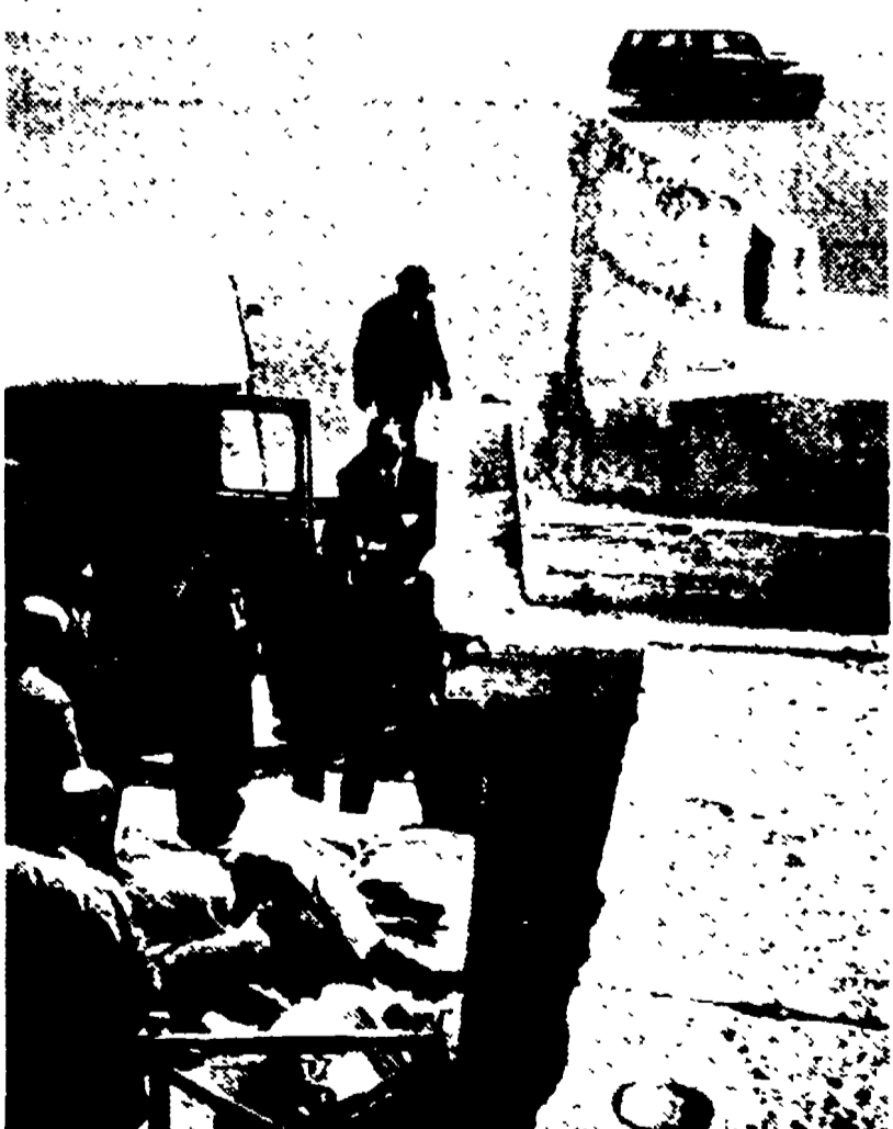
NELLA FOTO: I resti dell'Autunno vengono caricati su un furgone.

La colpa è del traffico. I frammenti dell'Autunno, la statua precipitata l'altra notte in piazza del Popolo, sono stati raccolti ieri mattina e trasportati con un furgone all'Antiquariato comunale, dove si tenterà il restauro. Causa del crollo, secondo i primi accertamenti, sembra siano state le forti vibrazioni del terreno provocate dallo intenso traffico che si svolge nella piazza.