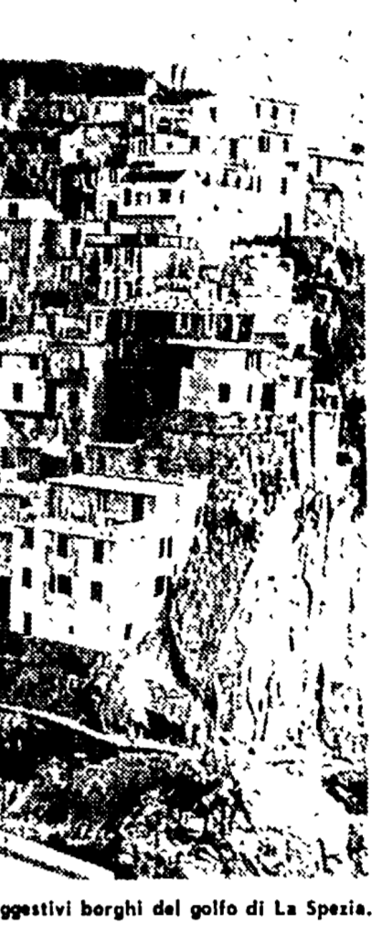
RIOMAGGIORE — Uno dei più suggestivi borghi del golfo di La Spezia.

La segnaletica stradale italiana è tutt'altro che perfetta: lo scorso anno con l'operazione (foto strada, l'Automobil Club diede la caccia a chi non ne rispettava gli avvertimenti: quest'anno saranno gli automobilisti che denunceranno invece le insufficienze dei segnali da rispettare.