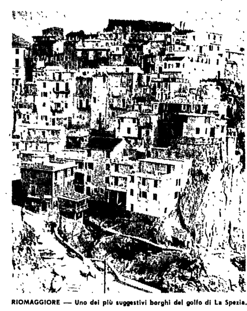
RIOMAGGIORE — Uno dei più suggestivi borghi del golfo di La Spezia.