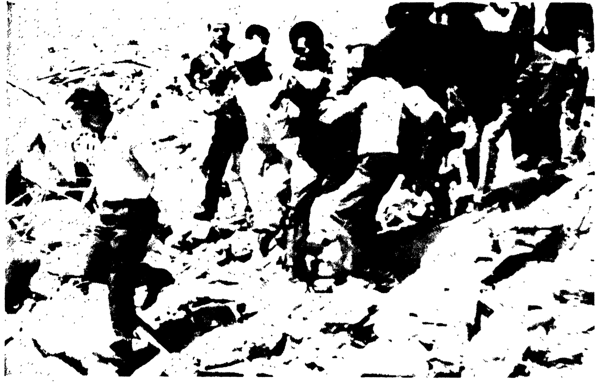
BORGHETTO S. SPIRITO — Operai e vigili del fuoco soccorrono un lavoratore estratto dalle macerie.

E' anche comproprietario dell'edificio — Dei sette morti ancora cinque si trovano sepolti sotto le macerie — Un intervento di Amasio ieri alla Camera