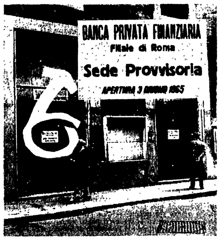
La Banca privata finanziaria ha aperto a Roma una sede provvisoria: è il primo passo sulla strada del tentativo di salvataggio del Credito commerciale e industriale. L'istituto milanese dovrebbe pagare i clienti con depositi inferiori ai 15 milioni.

La Banca privata finanziaria pagherà i risparmiatori dell'istituto romano - Il figlio del generale franchista Munoz restituirà il miliardo e mezzo allo scicco petrolifero?