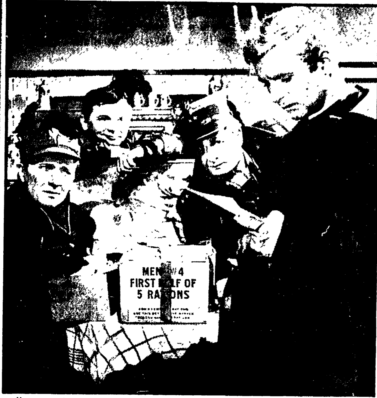
Una scena del film polacco «Il primo giorno di libertà»