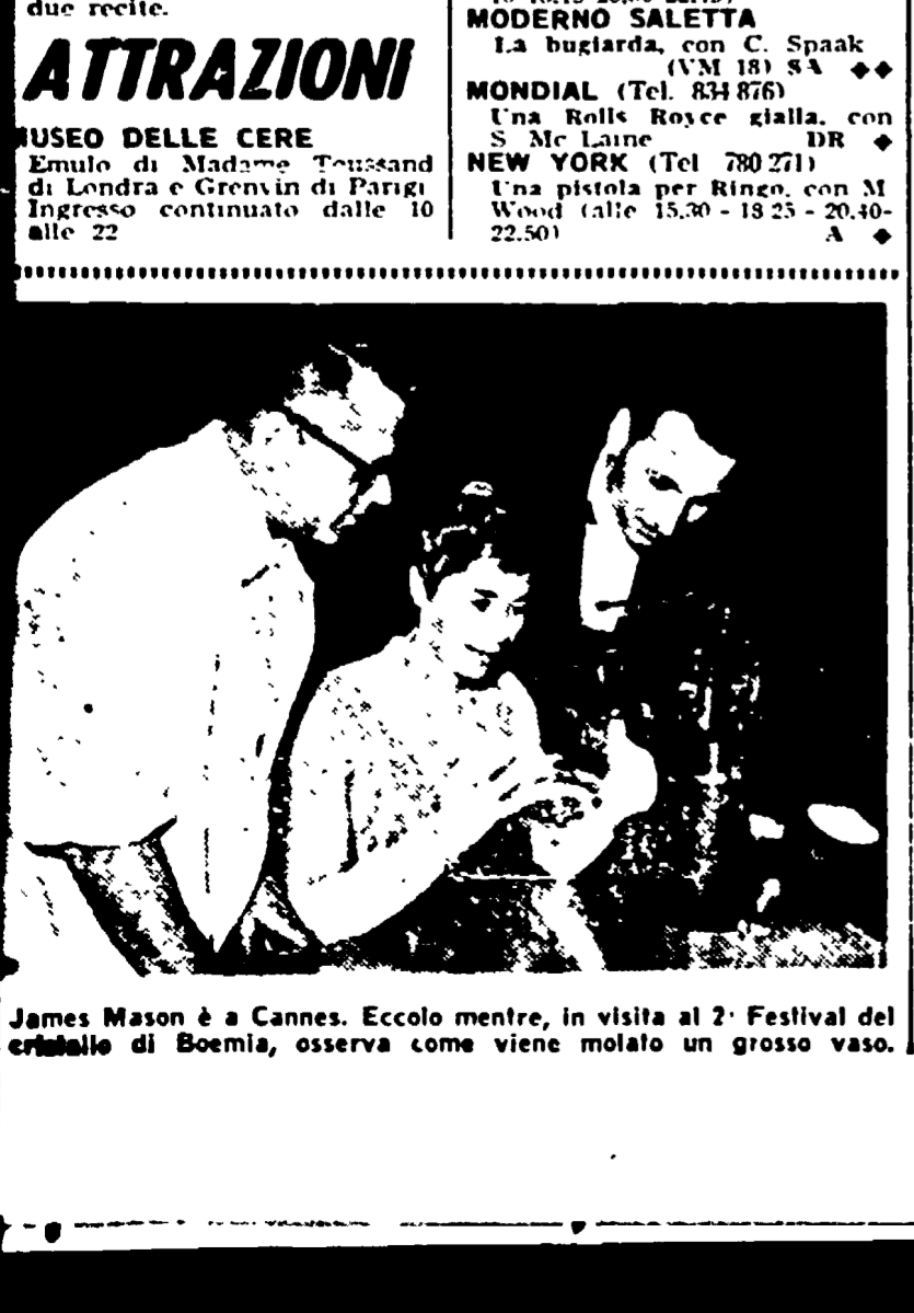
James Mason è a Cannes. Ecco mentre, in visita al 2° Festival del cinema di Boemia, osserva come viene molato un grosso vaso.