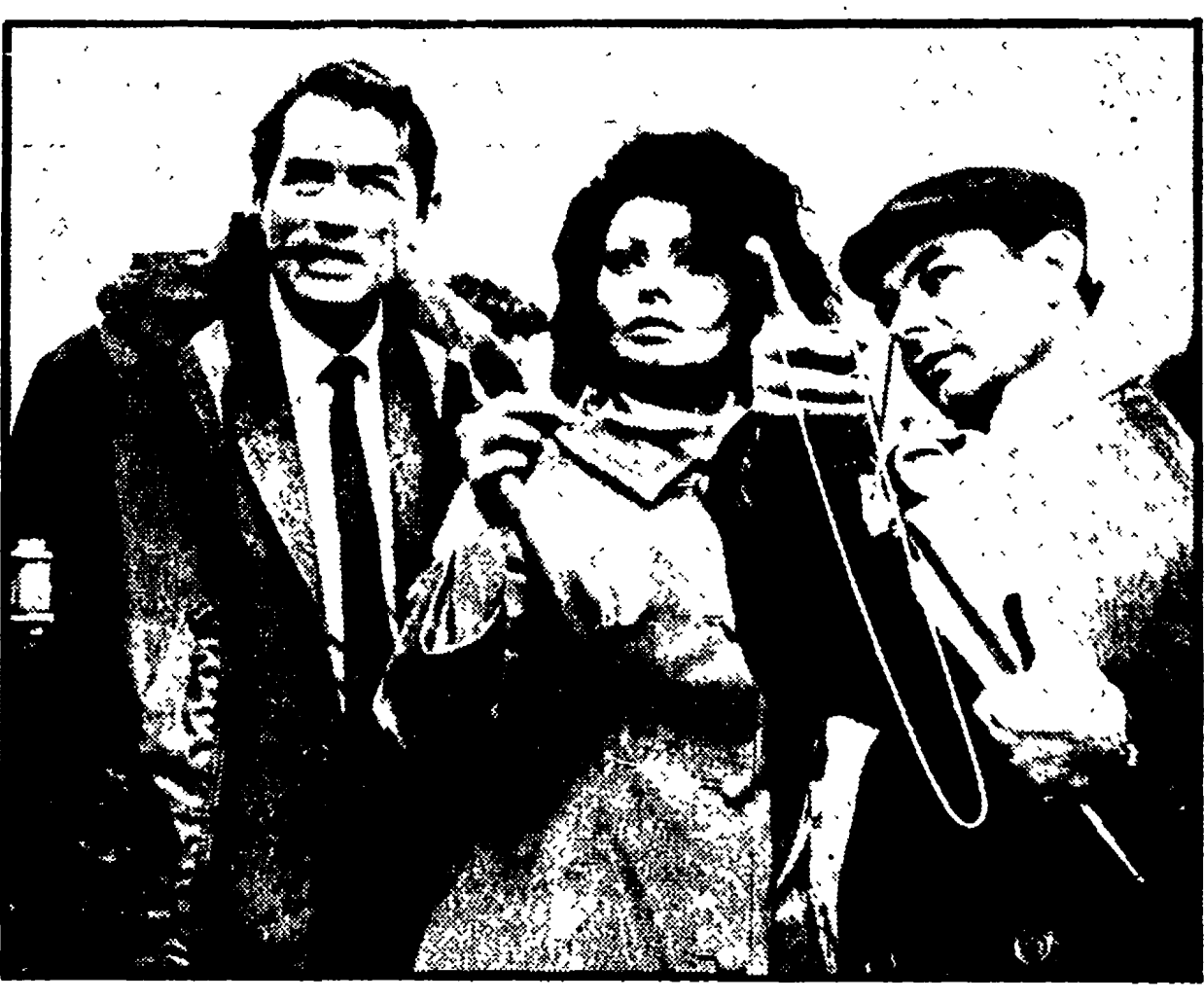
La «troupe» che sta girando il film Arabesque è da qualche giorno a Gatwick Airport nel Surrey. Le condizioni meteorologiche non sono mai eccellenti in questa stagione. In Gran Bretagna; ieri, tuttavia, è fatta ricerca alla più alta officina per girare una scena nella quale Sophia Loren deve finire bagnata con un pulcino. Nella foto: il regista Stanley Donen, noto per aver diretto, tra gli altri, il film Sciarada, dà alcune istruzioni a Sophia e al suo partner, Gregory Peck.