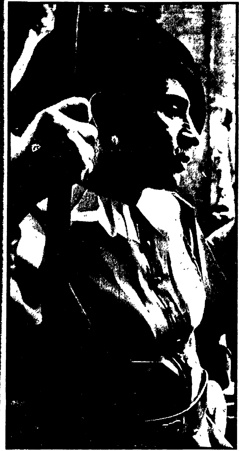
E' proprio lui: è Walter Chiari che ha dovuto indossare i panni di «aguzzino dei Papi» come diceva il Belli, e farsi crescere un bel palo di baffi, per interpretare insieme con Marcello Mastroianni, Vittorio De Sica, Sylvia Koscina e altri molti attori il film «Io, lo, e gli altri» di Blasetti