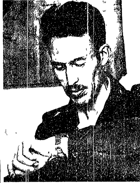
Boumedienne un colpo di stato cronometrato al secondo

Il comunisti provinciali di Camporasso è un mistero. In questi giorni, in un'aula di un municipio di un piccolo paese di montagna, si sono riuniti i comunisti per discutere di un problema che ha occupato tutti i cuori: il comunisti provinciali di Camporasso.