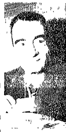
Domenico Zampini, il presidente di C dell'amministrazione provinciale

CAMPORASSO 2. Lo scandalo del comunisti provinciali di cui si parla da Camporasso è un mistero. In questi giorni, in un'aula di un municipio di un piccolo paese di montagna, si sono riuniti i comunisti per discutere di un problema che ha occupato tutti i cuori: il comunisti provinciali di Camporasso. Il comunisti provinciali di Camporasso è un mistero. In questi giorni, in un'aula di un municipio di un piccolo paese di montagna, si sono riuniti i comunisti per discutere di un problema che ha occupato tutti i cuori: il comunisti provinciali di Camporasso.