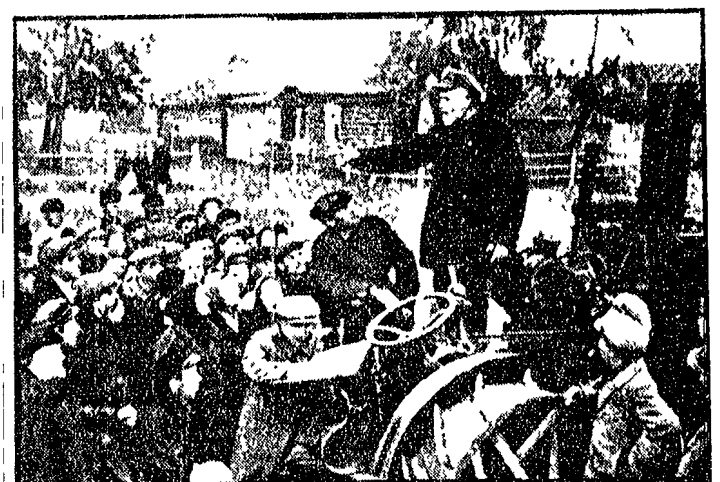
U.R.S.S., 1929 riunione in un colcos del distretto di Mosca