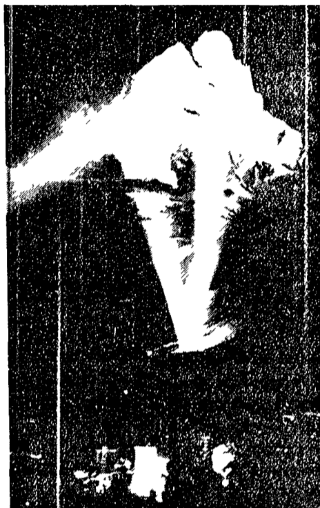
CERVINO - Una suggestiva immagine della cima del Matthehorn illuminata a giorno da potentissimi riflettori

Per la prima volta la vetta del Cervino apparirà oggi in Eurovisione in occasione del centenario della scalata della famosa montagna compiuta nel 1865 dal ventiquenne alpinista inglese Edward Whymper