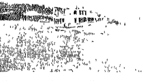
Il lago Trasimeno e una delle tre motonavi del servizio (anche notturno) di navigazione organizzato dall'Amministrazione provinciale

Verso l'anno abbiamo una trentina di castelli e in ogni caso si sa che il lago è un luogo di grande fascino. La vista distesa da questa riva sotto il sole tra gli alberi di ulivo e di castagno che si stagliano sul cielo è un spettacolo che non si può perdere. Il lago Trasimeno è un luogo di grande fascino. La vista distesa da questa riva sotto il sole tra gli alberi di ulivo e di castagno che si stagliano sul cielo è un spettacolo che non si può perdere.