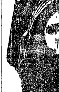
Maschera da danza Jokwe, Congo centrale