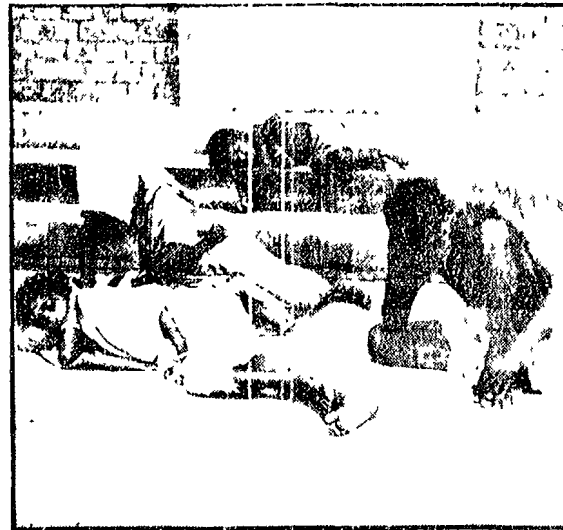
Un'immagine della miseria a Bombay