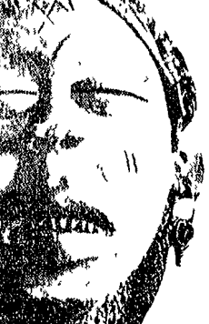
Maschera da danza Jokwe, Congo centrale

Le figurate, tadano così men... proprio Spoleto oggi potrebbe essere uno dei centri dell'informazione e del dibattito sulle arti attuali.