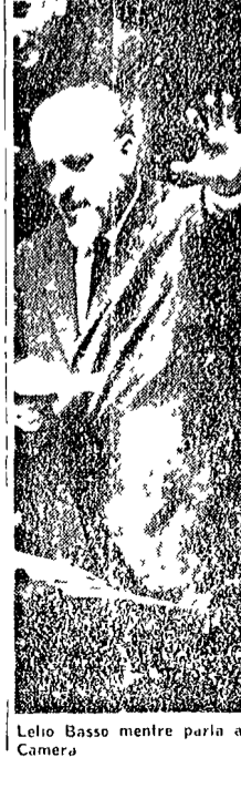
Lelio Basso mentre parla alla Camera