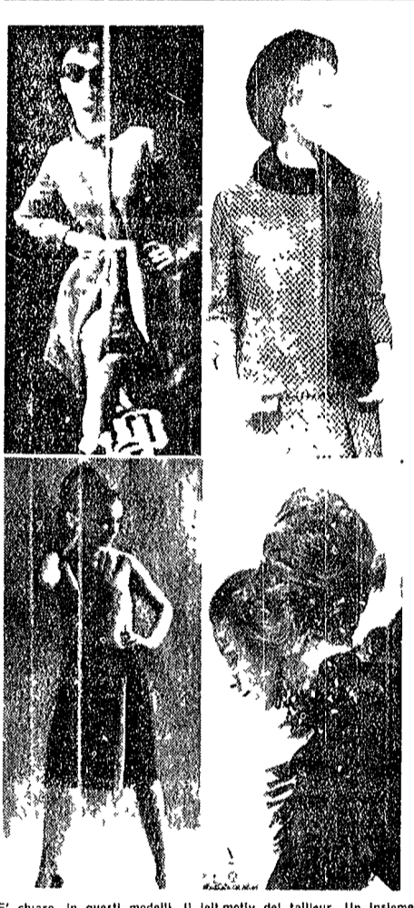
E' chiaro, in questi modelli, il leit motiv del tailleur. Un insieme di giacca e gonna...