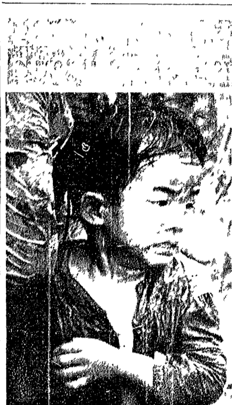
SUD VIETNAM — La tragedia di un villaggio contadino rifugiato nel piano d'una bomba appena uscita, terrorizzato, da una buca fangosa nelle quale si era rifugiato il suo villaggio, a nord di Phnom Hiep, è stato bombardato dagli americani presso d'assalto da bande di «rengers» di Saigon i quali credevano di trovarvi gruppi di partigiani. L'inferno è finito ma il bambino, aggrappato al braccio della madre, non se ne rende ancora conto

Si chiude stasera il Festival provinciale dell'Unità aperto venerdì scorso, che ha visto un'affluenza di compagni dai vari nuclei. Molti si sono particolarmente soffermati nello stand allestito a mostra della stampa comunista nazionale e locale. Nel corso del Festival molti hanno avuto un grande successo alcuni commentari quali quello sulla vita di Togliatti e il dibattito tenuto dal compagno on. Renato Bastianelli e del sen. Franco Bertini sui problemi del partito e sul partito unico da lavorare. E' presente oggi il compagno senatore Umberto Terracini, che ha tenuto il comizio di chiusura davanti a una folla strabocchevole.