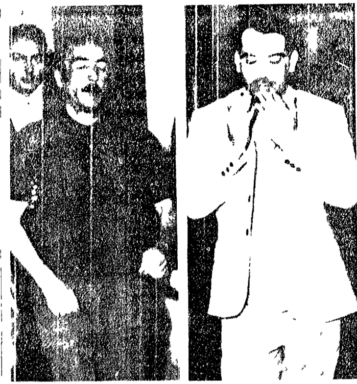
IN ALTO I DUE AMICI DEL RAPINATORE TRADOTTI A FIRENZE... (caption for the photo above)

Il giovane con la stella in fronte... (continuation of the main article)