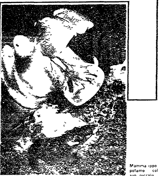
Mamma ippopotamo col suo piccolo

Al viaggiatore che visita il Niger da Bamako la capitale della Repubblica del Mali fino a Tombuctu antica capitale di un impero di centomila abitanti, si può dire che si tratta di un viaggio che non frequenta amiche e amici e perciò non ha la possibilità di scambiare le idee.