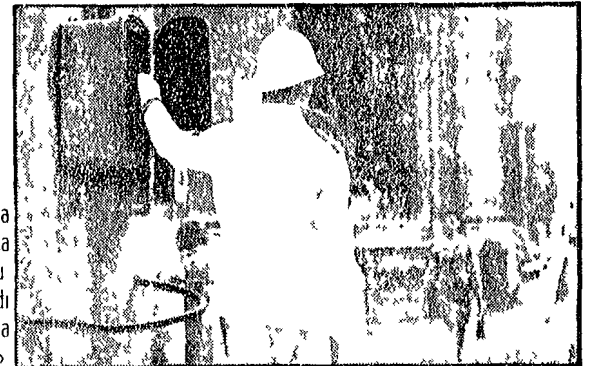
« Un semaforo a comando significa sopportare i rumori e i gas di scarico di 5 mila auto al minuto »