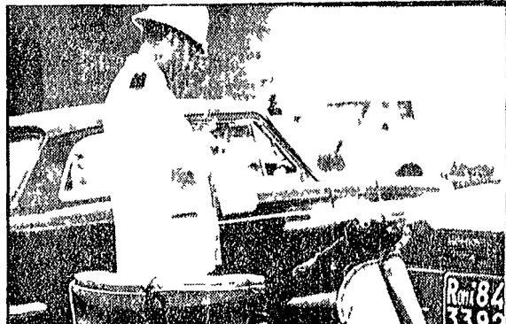
« Le multe un servizio che ci rende odiosi al pubblico, e crea quindi un altro motivo di tensione »