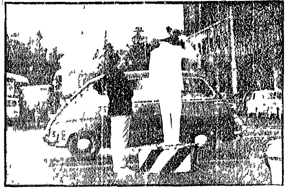
« Oltre un ora, spesso di più, di pedana, sotto il sole e l'acqua una condanna certa di malattie »

« Adesso vogliono toglierci anche il diritto di sciopero »