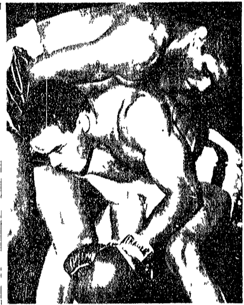
Una fase del combattimento fra Ernie Terrel e Eddio Machen.

Il campione mondiale di Terrel e De Piccoli per aumentare il disordine. Il campione mondiale di Terrel e De Piccoli per aumentare il disordine. Il campione mondiale di Terrel e De Piccoli per aumentare il disordine.