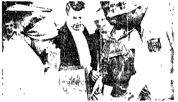
Un gruppo di atleti americani mentre acquistano souvenir a Kiev.

All'inizio da parte di un'intesa si affermò che secondo gli accordi di Los Angeles, i sovietici avrebbero dovuto vincere assai facilmente in quanto i movimenti atletici maschili e femminili sono stati studiati e perfezionati in un periodo di tempo molto lungo.