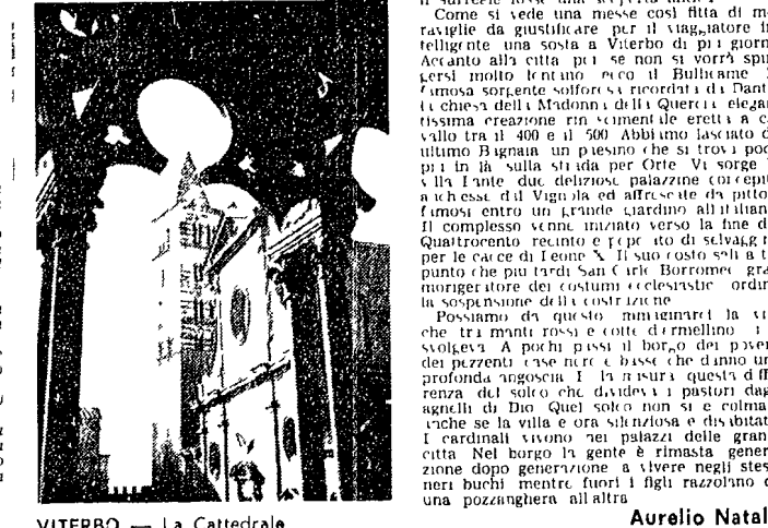
VITERBO - La Cattedrale

Un contrasto di colori e miserie. Mirabili monumenti del papato e nere case dei poveri - Una emozione profonda per chi visita la città con occhio intelligente - Gli stupendi dintorni - Il camping dei cardinali